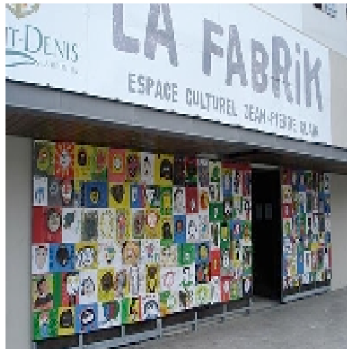
Récemment, l'espace de création artistique de la Fabrik mettait en avant les œuvres d'enfants.

A la Fabrik, on fabrique, cela va de soi. Récemment, l'espace de création artistique mettait en avant les œuvres d'enfants. Les portes de la Fabrik portent en effet des têtes sympathiques, conscientes, créatives, métissées, réunionnaises. Les enfants de Patate à Durand étaient les acteurs du projet « Mille têtes », éveillés par les conseils avisés des deux plasticiens du Collectif AléAAA.