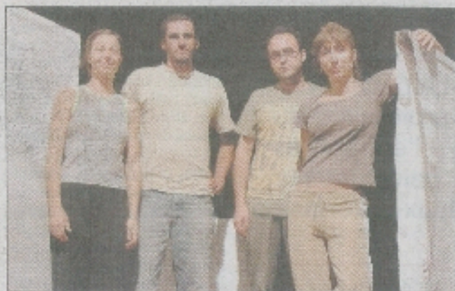
Deux danseuses et deux plasticiens pour une rencontre artistique inédite.

« Repères », au Collectif Aleaaa, vendredi 3 octobre, 20h, à la salle Guy-Alphonsine.